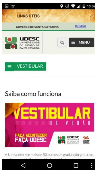
Figura 5: Links úteis

Ao retornar ao menu Udesc, o usuário encontra outros submenus como links úteis, no qual aparece a página oficial do concurso vestibular (figura 5).