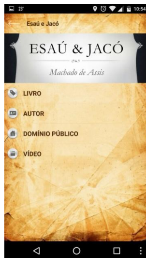
Figuras 4: Opção Esaú e Jacó