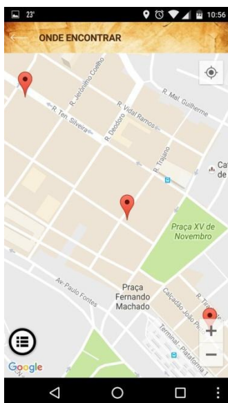
Figura 6: Onde encontrar