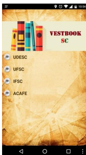
Figura 1 – Tela inicial do aplicativo Vestbook SC

A seguir serão apresentadas as principais telas e funcionalidades que compõem o aplicativo Vestbook SC . Na figura 1, é apresentada a tela inicial do aplicativo, onde o usuário seleciona a universidade que prestará vestibular e acessa informações sobre as obras de literatura: