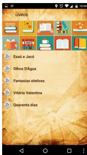
Figura 3: Opção Livros

Considerando que o usuário optou pelo ícone de Livros na tela anterior, a figura 3 mostra todas as obras de literatura referentes ao vestibular da Udesc: