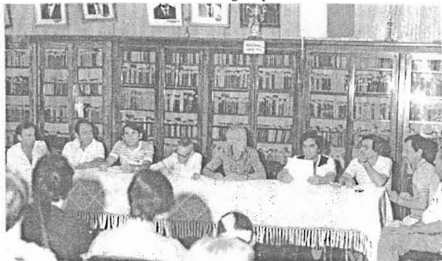
Foto 1: Posse da Diretoria da Liga na década de 80. Ao fundo parte do Acervo da Biblioteca.