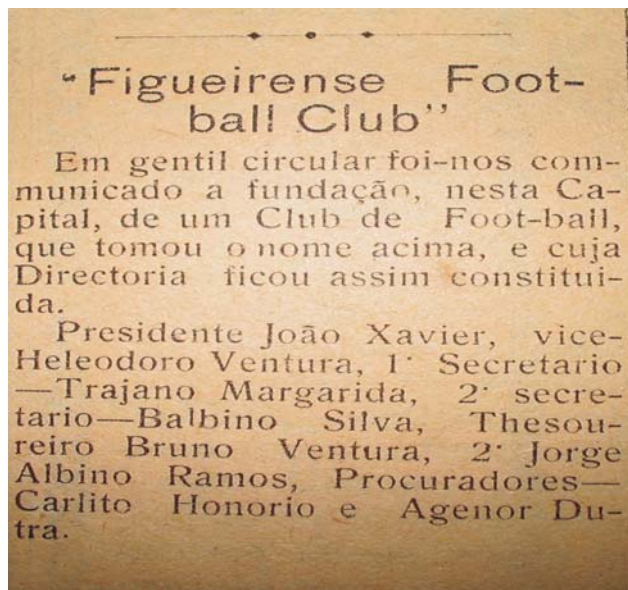
Figura 1: Fotografia do jornal “O Estado” da 1ª notícia datada de 11-07-1921

com as notícias mais importantes sobre o Figueirense nas décadas de 1920 e 1930.