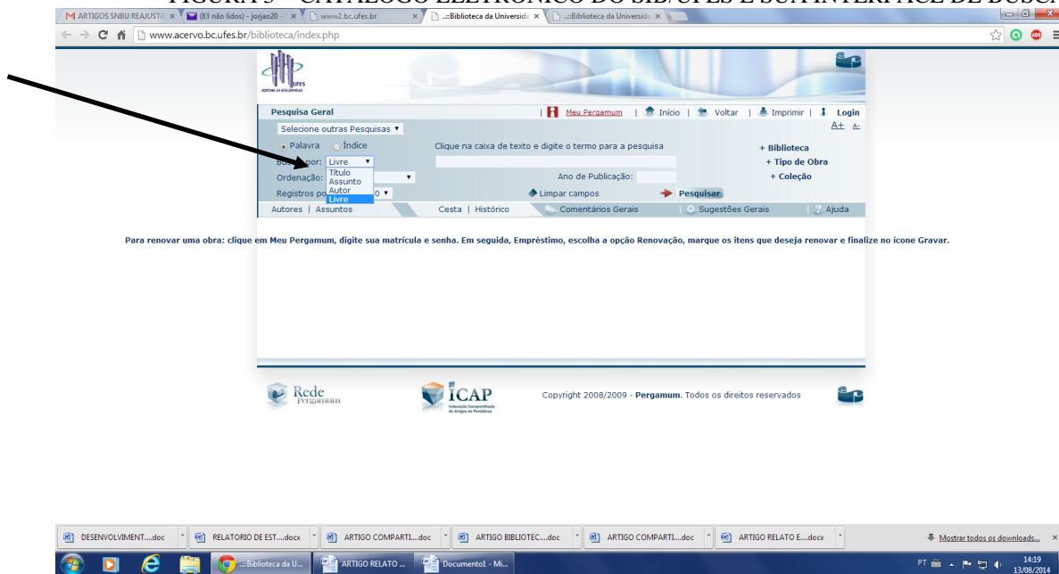
FIGURA 3 – CATÁLOGO ELETRÔNICO DO SIB/UFES E SUA INTERFACE DE BUSCA

A presença das TICs faz-se fortemente imbuídas no processo de busca e recuperação da informação, pois a unidade informatizou muitos de seus serviços, sobretudo ao que se refere à localização dos itens, utilizando um catálogo eletrônico, na qual a informação pode ser pesquisada sob vários aspectos inerente à obra, como: autor, título, palavra-chave, etc (Figura 2).